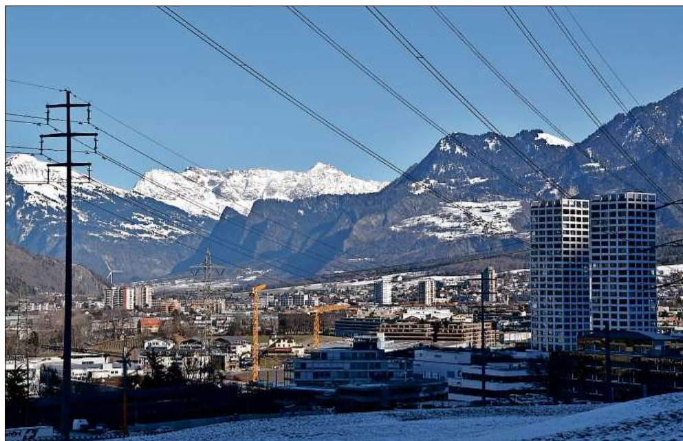
Es ist keine Wolke auszumachen. Bereits zur Mittagszeit legt sich Schatten über die Stadt.

Baugesellschaft Kino Chur West, vertreten durch domenig ARCHITEKTEN AG, Chur, für Neubau Kinozentrum mit Einstellhalle und Verbindungspasserelle zum Einkaufszentrum City West und Umweltverträglichkeitsprüfung (UVP), Sommeraustasse 7