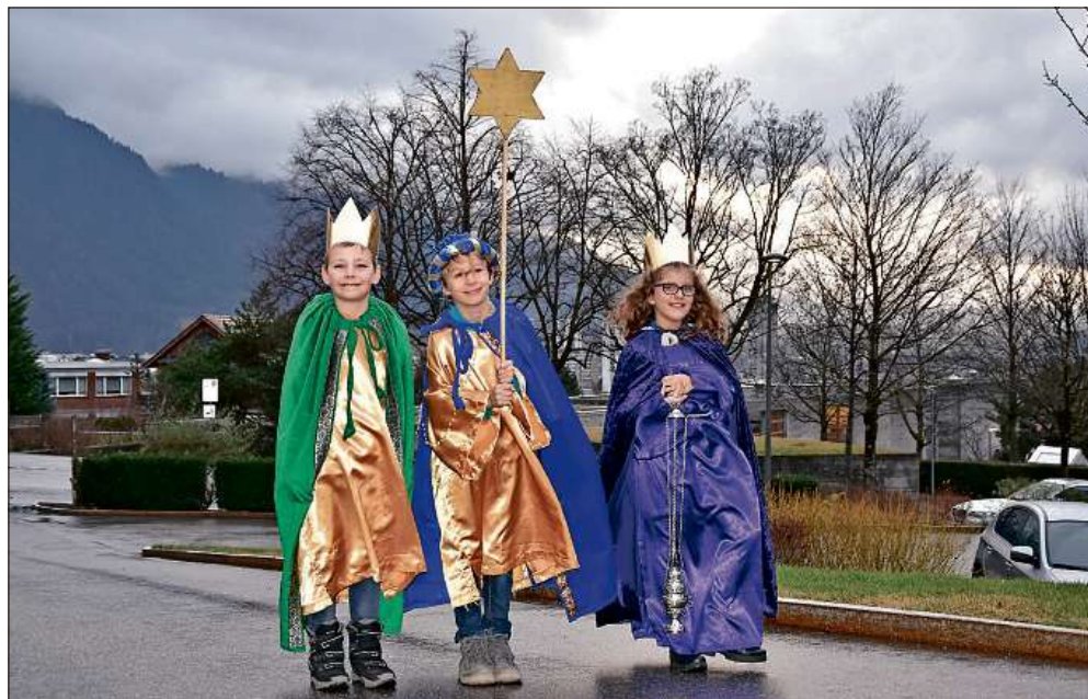
Sternsängerinnen und -sänger waren unterwegs – wie hier auf dem Weg zum Kantengut.

3. Die Nettoinvestitionen für das Jahr 2020 betragen Fr. 54 934 000.– (einstimmig).