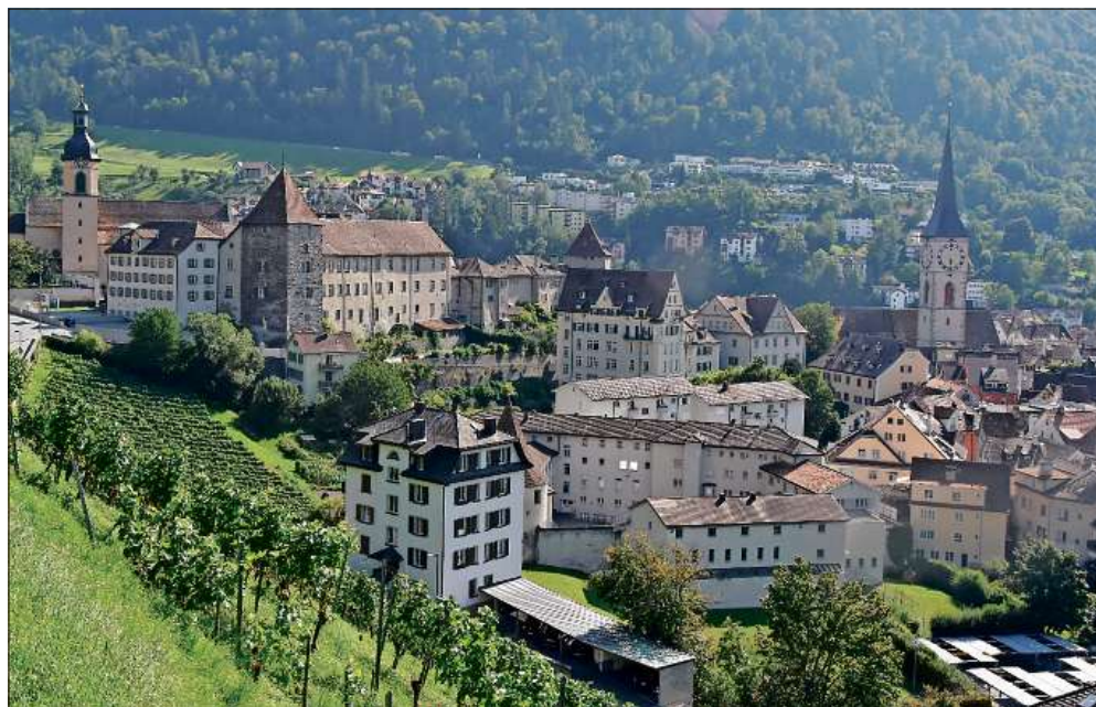
Der Herbst kündigt sich an. Die Churer Reben werden von der milden Herbstsonne erwärmt.