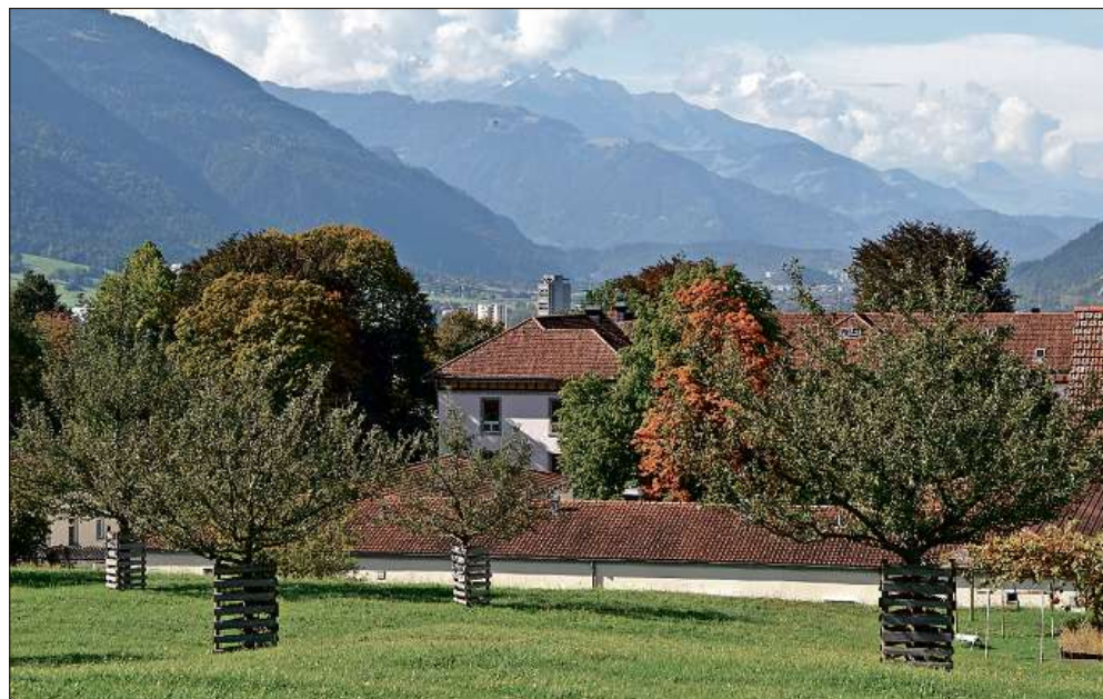
Allmählich verwandeln sich die Blätter der Bäume in bunte Herbstfarben, geniessen wir die angenehmen Temperaturen im Bündner Rheintal.