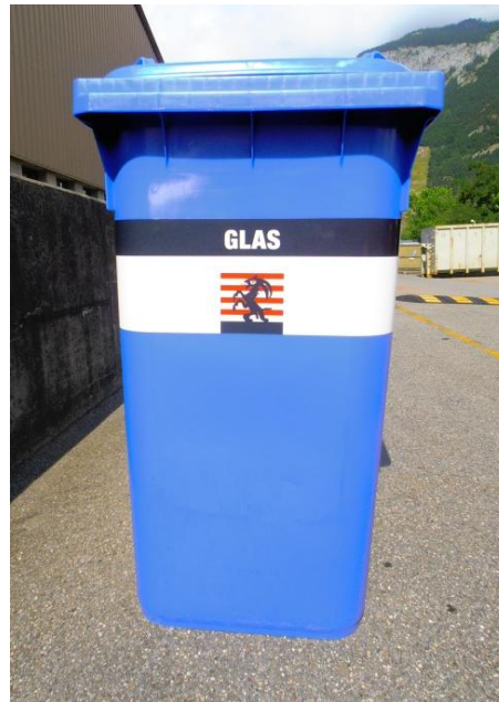
Glas, Total 26 Stk.