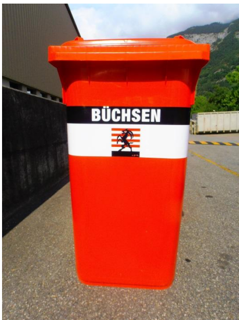
Büchsen, Total 14 Stk.