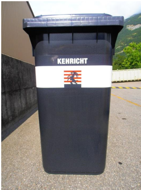
Kehricht, Total 50 Stk.