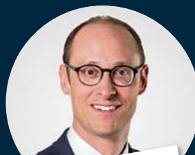
Martin Candinas Nationalrat