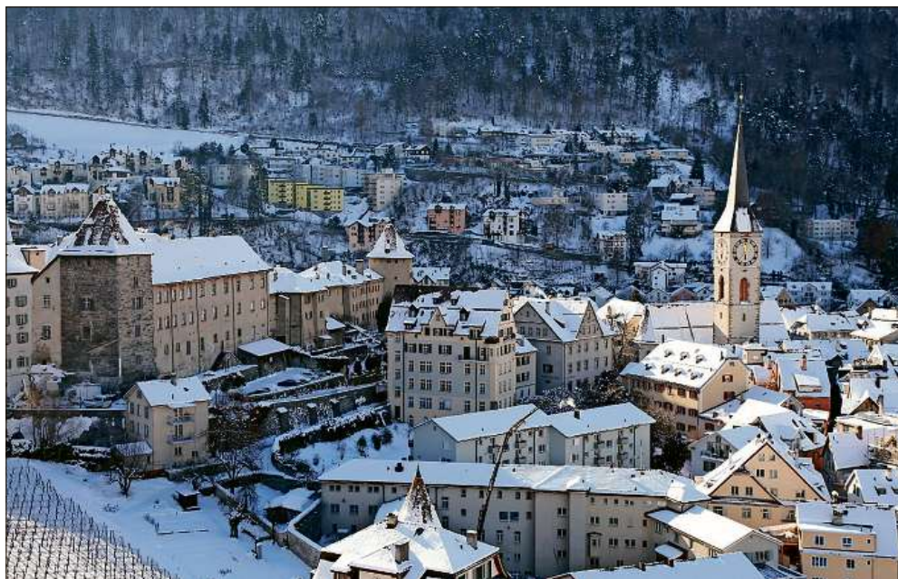
Wenn Schnee und Frost Chur verzaubern.