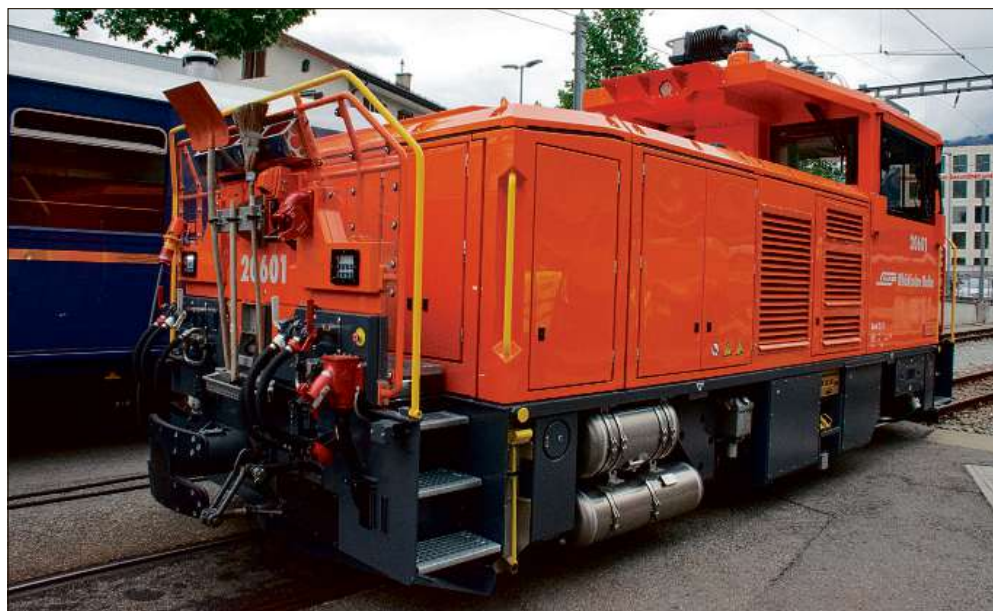
Am Montag, 3. August, wurde die erste Elektro-Akkulokomotive der RhB dem Betrieb in Chur übergeben. Mit den neuen Fahrzeugen werden Lärmemissionen deutlich und Abgasemissionen vollständig reduziert.